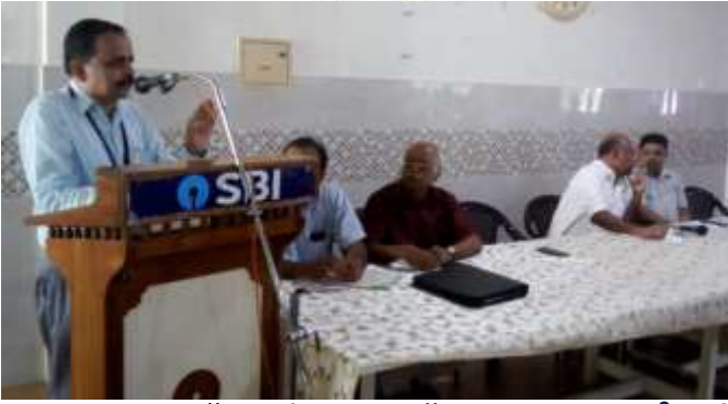
ലോക്കൽ ഹെഡ് ഓഫീസിൽ വച്ച് നടത്തിയ മെഡിക്കൽ ബെനിഫിറ്റ് സ്കീം സെമിനാർ.