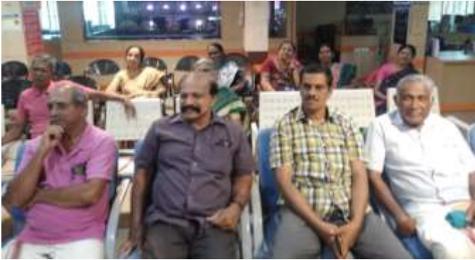
വൈക്കം ഏരിയാ കമ്മിറ്റി മീറ്റിംഗിലെ സദസ്സിന്റെ ഒരു വീക്ഷണം.